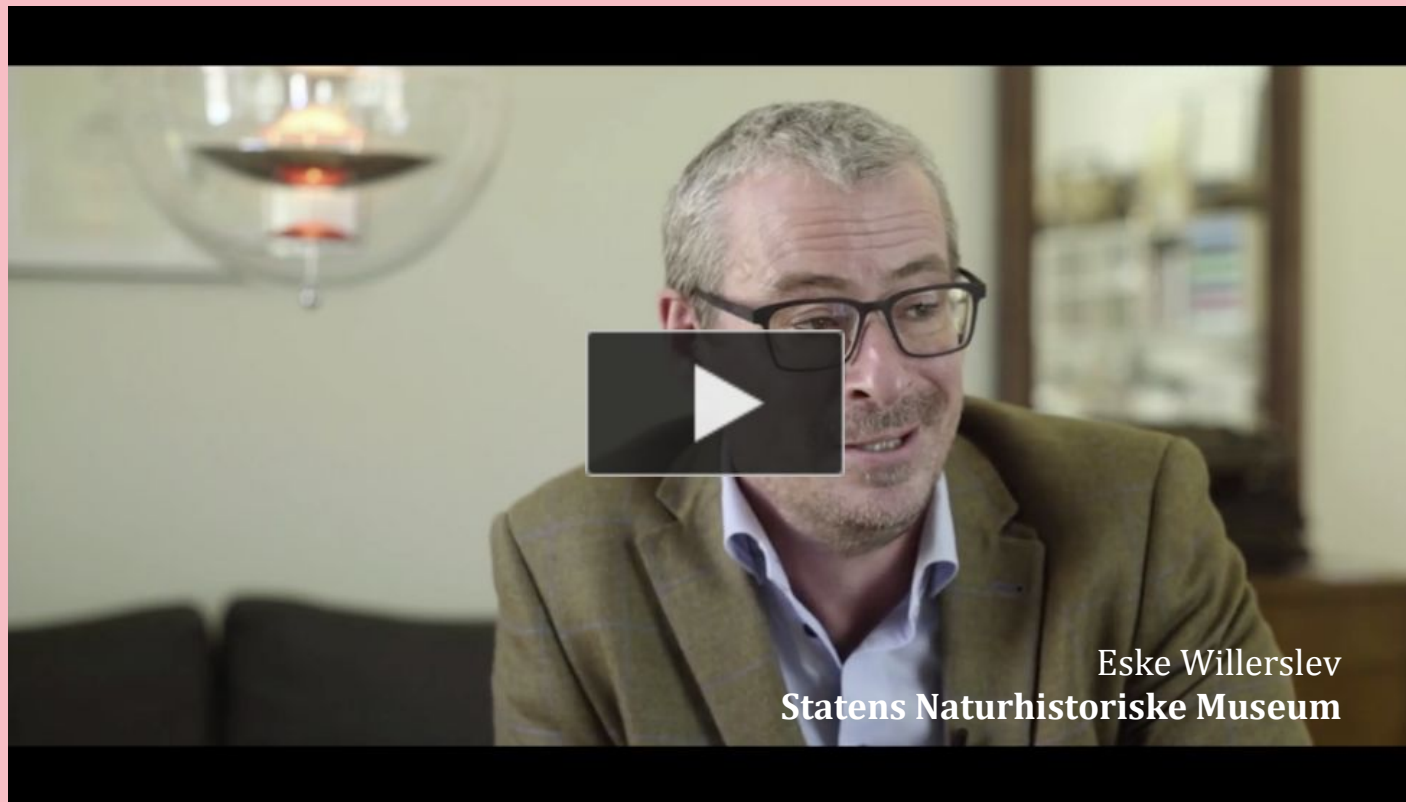
Eske Willerslev Statens Naturhistoriske Museum

https://snm.ku.dk/skoletjenesten/grundskole/materialer/beskriv-verden/forskerne-beskriver-verden/